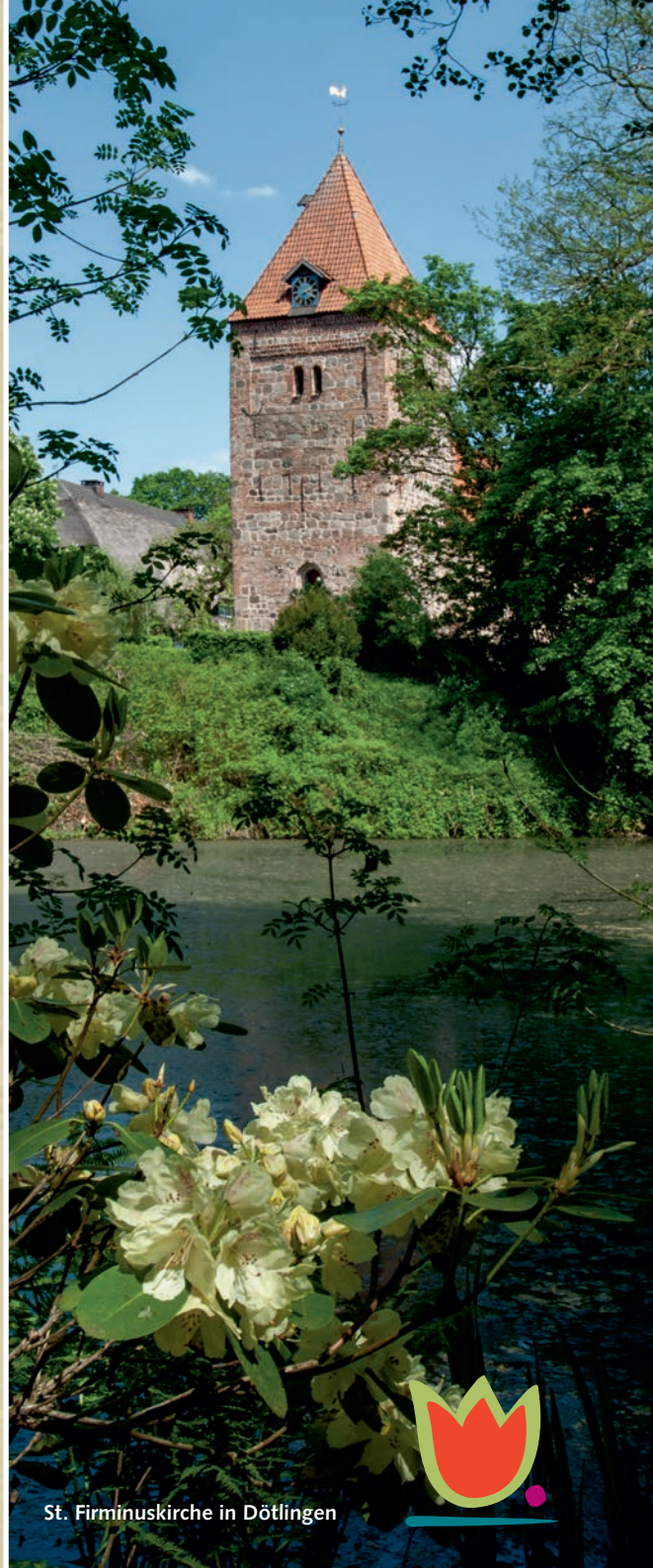
St. Firminuskirche in Dötlingen

Entdecken Sie die Möglichkeiten auch über unsere vier Tourenvorschläge auf www.doetlinger-gartenkultour.de